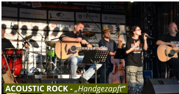
ACOUSTIC ROCK - „Handgezapft“

Gerne stellen wir den Kontakt zu den Bands für Sie her!