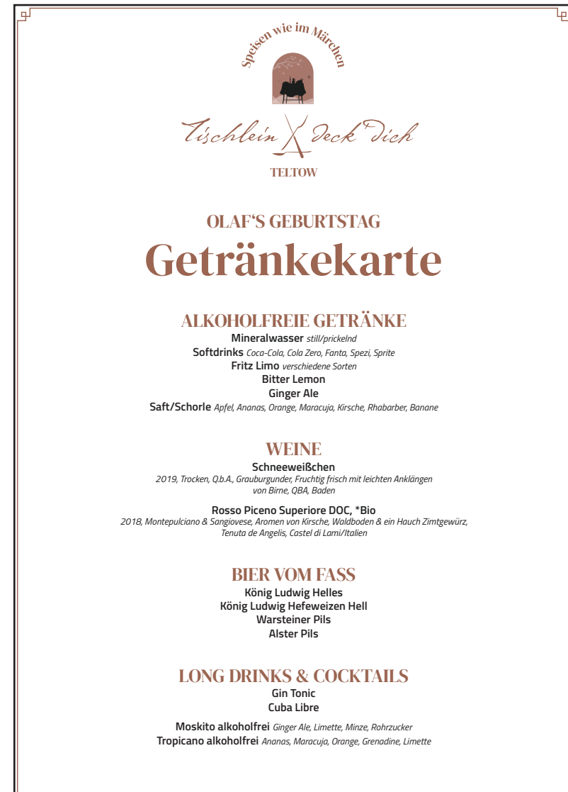
Beispiel kleine Getränkekarte